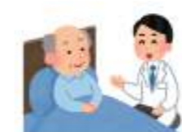
訪問看護・訪問介護

☆在宅利用者は居宅サービス受給者と地域密着型サービス受給者の合計数です。 ☆在宅サービス受給者は要介護認定者の年度で少し差があるが平均67%はいます。 ☆地域密着型サービス受給者数は5年間で約3.5倍と大きく増加しています。