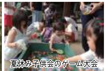
夏休み子供会のゲーム大会