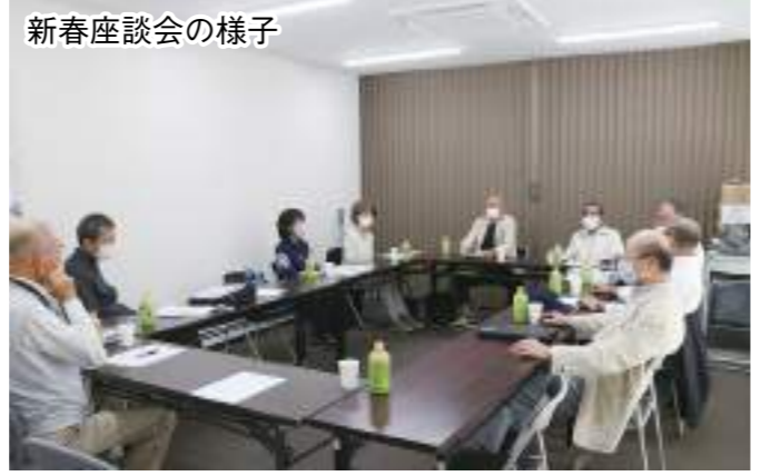
新春座談会の様子

番は人と人が対面し、お互いに声を掛け合うことが何より大切だと考えます。川西市内には、単位クラブの新設が可能と思われる地域がまだまだあります。私たちは今後、こうした地域に直接足を運び、市老連の魅力を伝えて、そして活動の現状を一緒に体験していただき楽しんでもらい、参加しやすい環境づくりを推進していきます。その全ては会員増強につながり、ゆくゆくは市老連活動の活性化につながっていくと確信しています。皆さまのご協力なくしては何もできません。今後ともどうぞよろしくお願いたします。