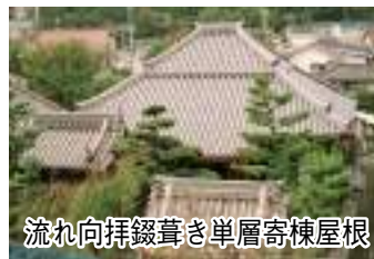
流れ向拝鋸葺き単層寄棟屋根

覚正寺では『総永代経法要』(5月)・『お盆法要』(8月)・『報恩講法要』(10月)を中心に、毎月の例会を実施しています。また、毎年夏休みには『夏季子供会』を開催し、「本堂の清掃」「お経の練習」「ゲーム大会」を早朝から行っています。(小学生以下どなたでも参加可能・夏休み初めの一週間・毎朝7時~8時まで・『盆踊り』の時に修了式を行います)。当山掲示板および『覚正寺だより』(年4回発行)にて各法要のご案内をしておりますが、どなた様もご参拝いただけます。