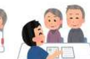
ケアマネージャーへの相談

☆介護認定者で在宅サービス受給者(居宅サービスと地域密着型サービス)の数はこの五年間を見ると平均して六十七%はいます。介護保険施設を望むも入居に難。有料老人ホーム等は高額で、本人の希望もあり、自宅の在宅介護者が多いのが現状です。介護する人が少ないのも問題です。(次ページへ)