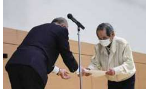
岡田会長 あいさつ