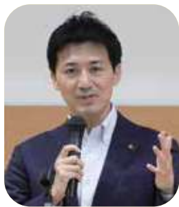
川西市長 越田謙治郎