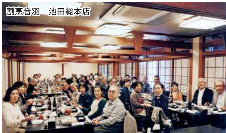
割烹音羽 池田総本店

乾杯のあいさつが終わり、ビールやお酒それぞれの好みを選び、料理に舌鼓をうちながら、カラオケができないため、ピンゴゲームなどを挟み楽しい2時間余りをあっという間に過ごしました。残念ながら、参加したくてもできなかった会員には、後日敬老の日のしるしとして記念品を贈らせていただきました。