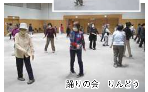
踊りの会 りんどう