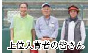
上位入賞者の皆さん